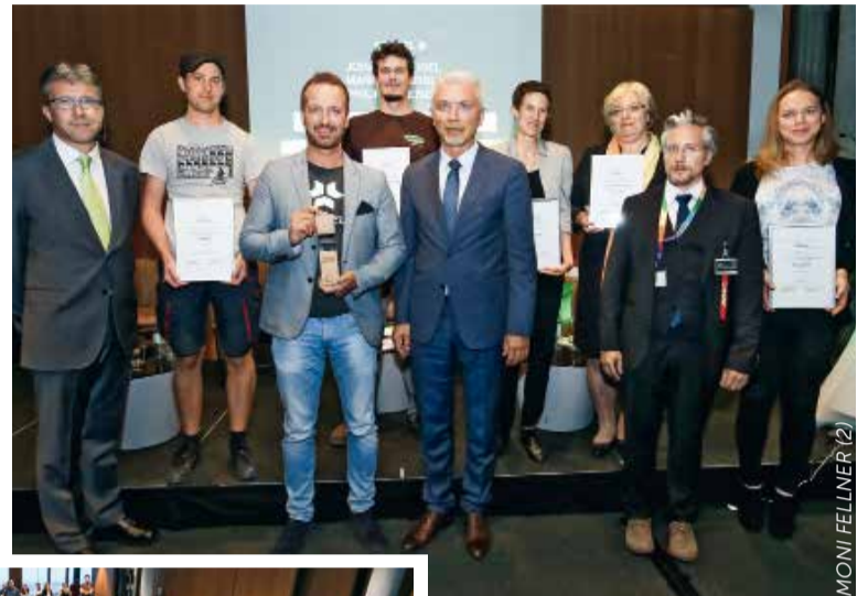
Forum Green Logistics 2016 – Verleihung des Pacemaker Awards

auf der Stärkung der interdisziplinären und branchenübergreifenden Kooperation auf nationaler und internationaler Ebene mit einem klaren Blick in die Zukunft. Das Forum Green Logistics 2030 ( www.forumlogistics.at ) ist ein langfristig angelegtes Projekt für die Schaffung eines nachhaltigen Bewusstseins und die Imageverbesserung der Transportwirtschaft und Logistik, das Entscheidungsträger und Experten vernetzt und auf ihrer Reise in das Jahr 2030 begleitet.